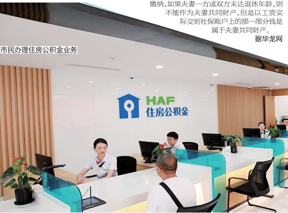
市民办理住房公积金业务