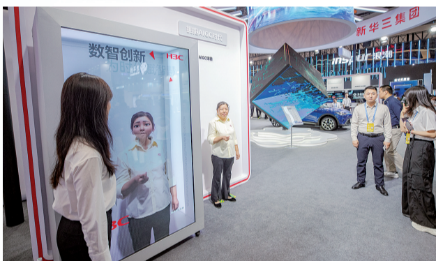
觀眾體驗生成AIGC虛擬形象

“來我們這個展台體驗剪刀門炫酷跑車的年輕女觀眾特別多！”9月5日，普通觀眾可以預約進入智博會展館參觀，不少智能網聯新能源產業相關車企紛紛“寵觀眾”。