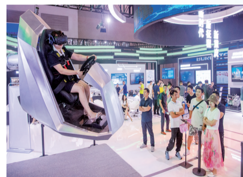
嘉賓體驗“車載XR智能座艙”