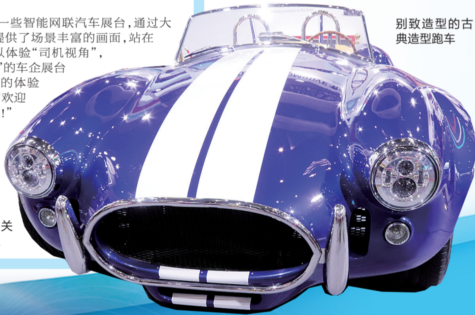
別致造型的古典造型跑車