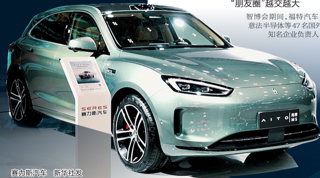
賽力斯汽車