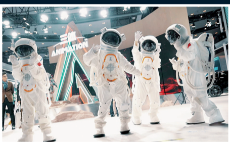
智博會上的“未來感”元素

9月6日，備受矚目的2023中國國際智能產業博覽會圓滿落幕，在成果通報會上，重慶市人民政府副市長江敦濤介紹，2023智博會充分發揮匯聚資源、智聯世界的平台效應，有力呈現了國際展覽的一流水平、國際論壇的世界影響力，精品薈萃、亮點紛呈、成果豐碩。