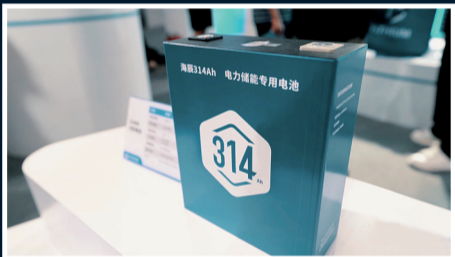
萬次循環充電儲能電池 新華社發