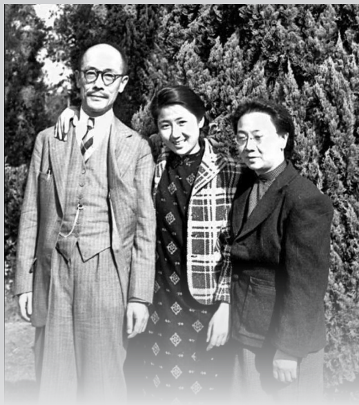
周均时夫妇与女儿周遂安

他就是被誉为“川康民革五魂”之一的周均时，作为中国早期高科技专家和著名数学家，他用卓越的智慧、学识和奋不顾身的革命精神，谱写了一曲不朽的历史颂歌。