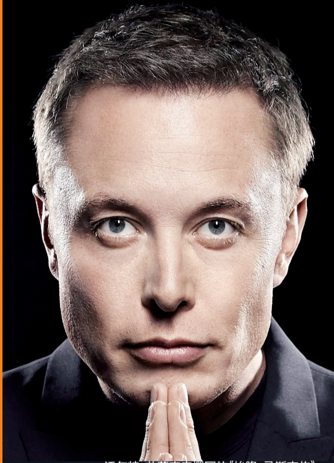
沃尔特·艾萨克森撰写的《埃隆·马斯克传》

新近出炉的《马斯克传》颇受关注，作者沃尔特·艾萨克森，是美国著名传记作家，也是《乔布斯传》的作者。为写作这本长达600余页的传记，艾萨克森深度跟访了马斯克两年多，并访问了接近马斯克的250多位朋友。除了在诸多领域取得的非凡成就，马斯克的情感历程在这本传记中也是首次全面披露。