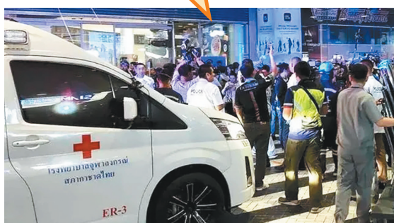
曼谷商场枪击事件

总理赛塔于3日亲赴医院看望中国受伤人员。赛塔和班比副总理兼外长还分别致电中国驻泰国大使韩志强,代表泰国政府对不幸遇难的中国公民表示哀悼,对受伤人员表示慰问,强调泰方将迅速依法查办此次事件,强化治安管理,确保为来泰中国公民提供可靠安全环境。