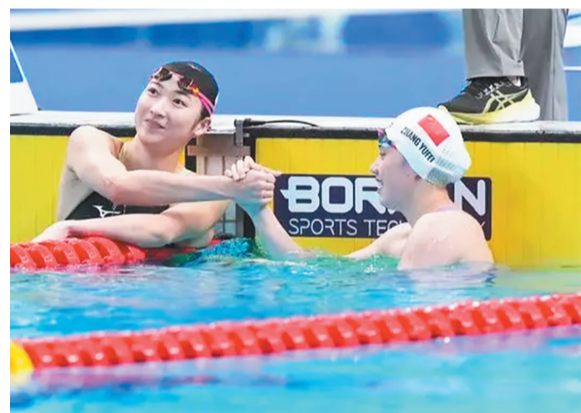
在“记忆之花”中,将集中呈现运动员们所留下的感人瞬间。