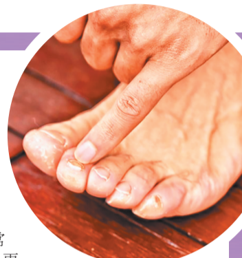
已经变形的脚趾和脚指甲