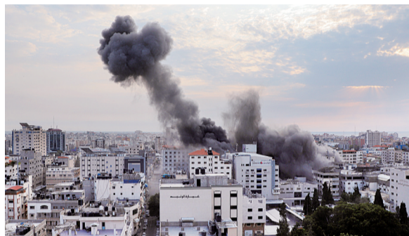
加沙城拍摄的以色列空袭后的浓烟

瓦尔加表示,近期油价下跌一定程度上是市场消化了沙特俄罗斯额外减产的影响。与此同时,全球央行在货币政策上的谨慎立场也给需求端造成了冲击。他提醒,沙特是具有影响全球供应和价格的超级能源大