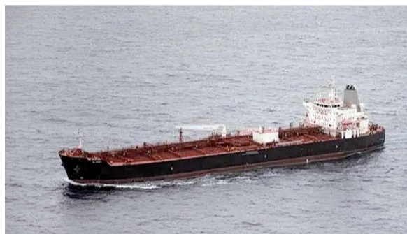
伊朗“克拉维尔”号油轮在大西洋公海海域行驶