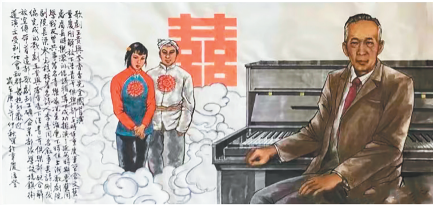
著名画家潘登绘时乐濛在下浩辅导排演歌剧《王贵与李香香》