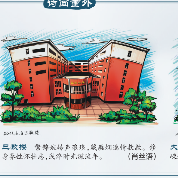
2021.6.3 三歌楼 三歌楼 繁锦婉转声琅琅,葳蕤婀娜情款款。修身养性怀壮志,浅吟时光深流年。(肖丝语)