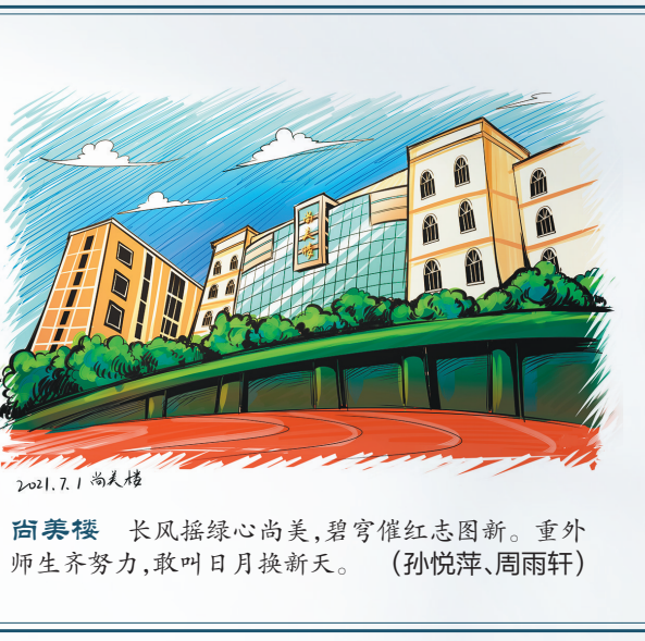
2021.7.1 尚美楼 尚美楼 长风摇绿心尚美,碧穹催红志图新。重外师生齐努力,敢叫日月换新天。(孙悦萍、周雨轩)