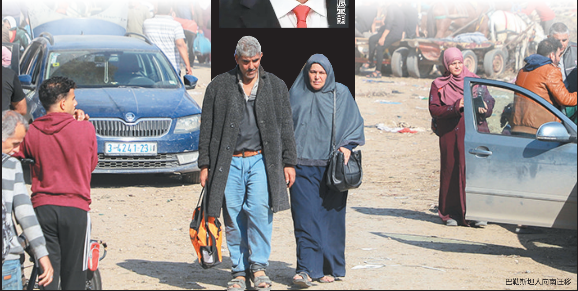
巴勒斯坦人向南迁移