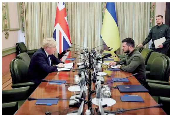
约翰逊与泽连斯基举行会谈(资料图片)

而这宗事件让人想起今年10月末在航空军事学校发生的“毒蛋糕”外卖事件。据称，当时一名外卖员将掺有致命毒药的40斤重蛋糕和威士忌，送到俄罗斯阿尔马维尔高等军事航空学校，企图暗杀数十名俄罗斯高级飞行员。但是俄罗斯飞行员发现了端倪，切开的蛋糕未被