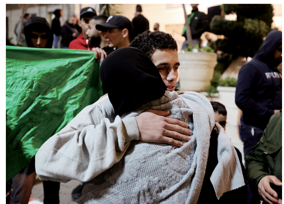
11月26日，在约旦河西岸城市比拉，获释巴勒斯坦被关押人员与亲人团聚。

哈马斯25日释放的第二批被扣押人员为13名以色列人和4名泰国公民，他们被移交给红十字国际委员会。媒体记者拍摄的视频画面显示，红十字国际委员会的小型巴士运载这17人，深夜经由拉法口岸进入埃及，尔后转交给以色列。以色列当天释放了39名被关押在