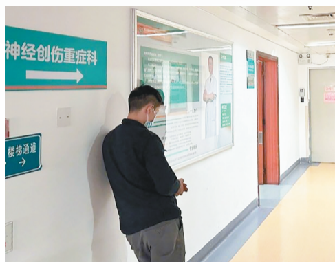
伤者父亲在医院等待会诊