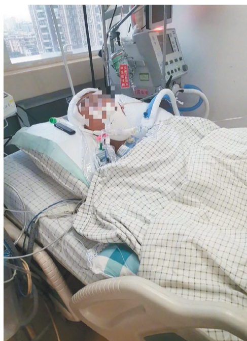
伤者目前仍在广州珠江医院ICU治疗