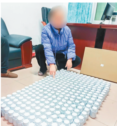
民警查获的假药

11月下旬，根据前期掌握的线索和后期缜密的侦查，在全面掌握该团伙组织框架、固定犯罪证据、锁定嫌疑人后，市公安局打假总队组织青年民警会