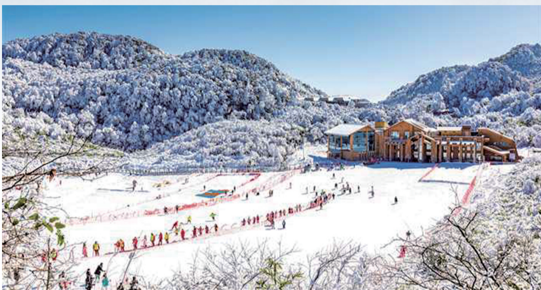
南川金佛山滑雪场尽显冰雪运动魅力