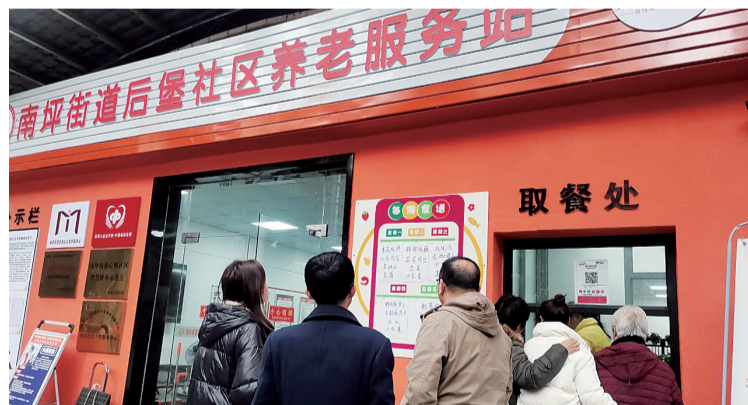
南坪街道后堡社区养老服务站助餐点

“年龄大了,买菜自己做太累,到外面馆子点菜吃又觉得太贵,怎样才能吃上一顿省心又便宜的可口饭菜?”对于家住南岸区南坪街道后堡社区的老年居民来说,“开在家门口”的社区助餐点解决了他们的吃饭问题。