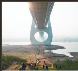
民众在大桥下“打卡”拍照