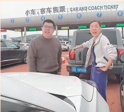
奔驰车主以及帮腔女子被曝是河北农大老师,校方回应称将核实。