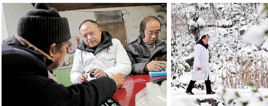
豆世均给老人看病