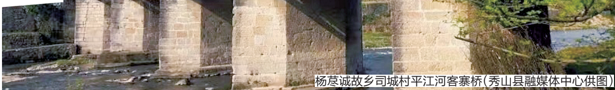
杨苒诚故乡司城村平江河客寨桥