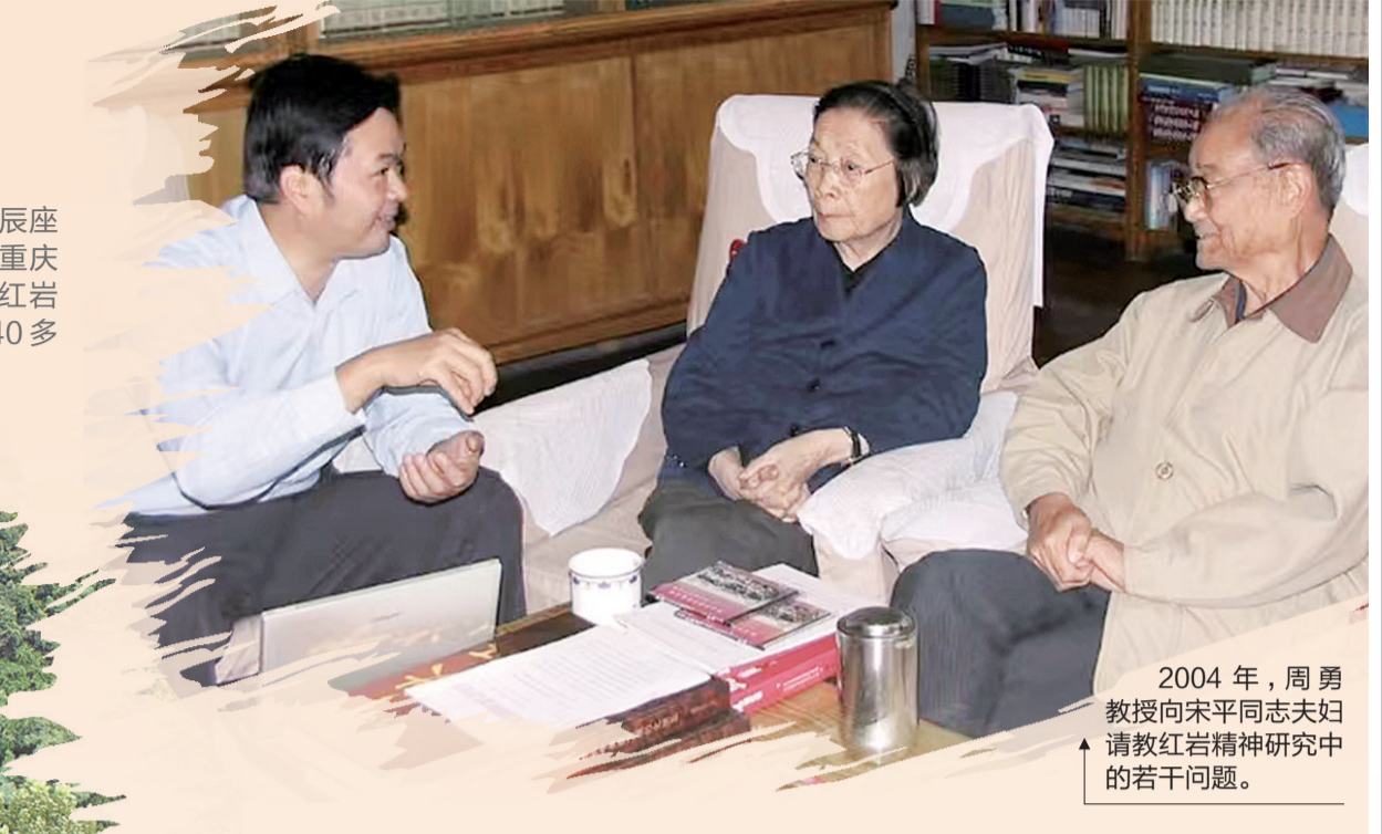
2004年，周勇教授向宋平同志夫妇请教红岩精神研究中的若干问题。