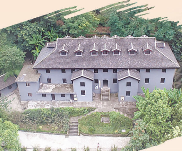
红岩村八路军驻重庆办事处遗址(渝中区红岩村)

3月5日，纪念周恩来总理126周年诞辰座谈在重庆曾家岩50号周公馆举行。会上，重庆市重庆史研究会名誉会长周勇以《发生在红岩村的思政教育“精彩一课”》为题，讲述他40多年来苦苦追寻周恩来一句话的事情。