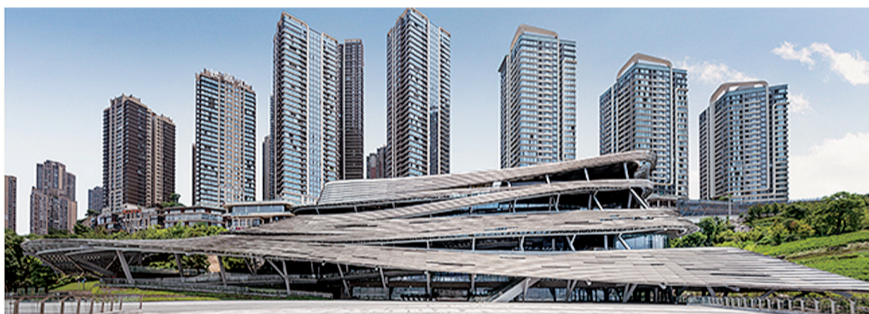
重庆市规划展览馆