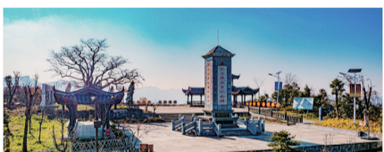
水车坪红军革命纪念馆