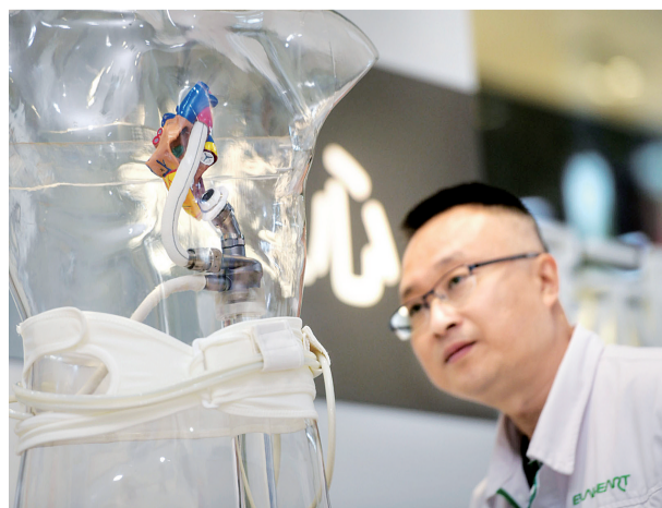
永仁心医疗推出新一代人工心脏产品EVA-Pulsar™