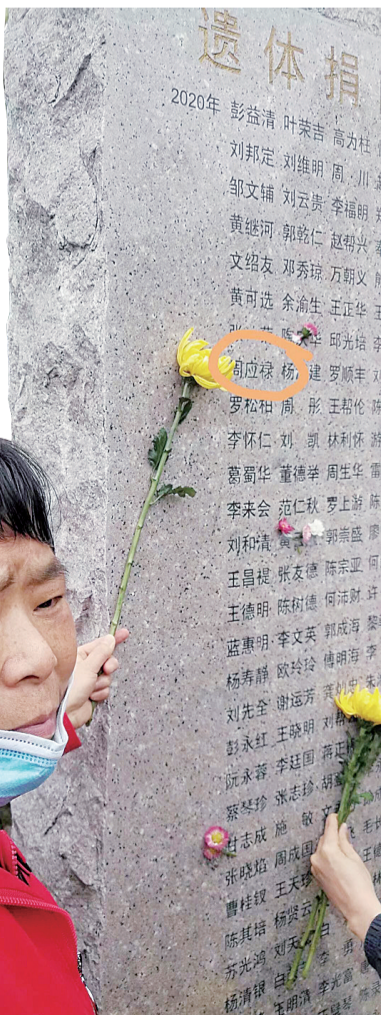
吴文界用菊花指着老公的名字