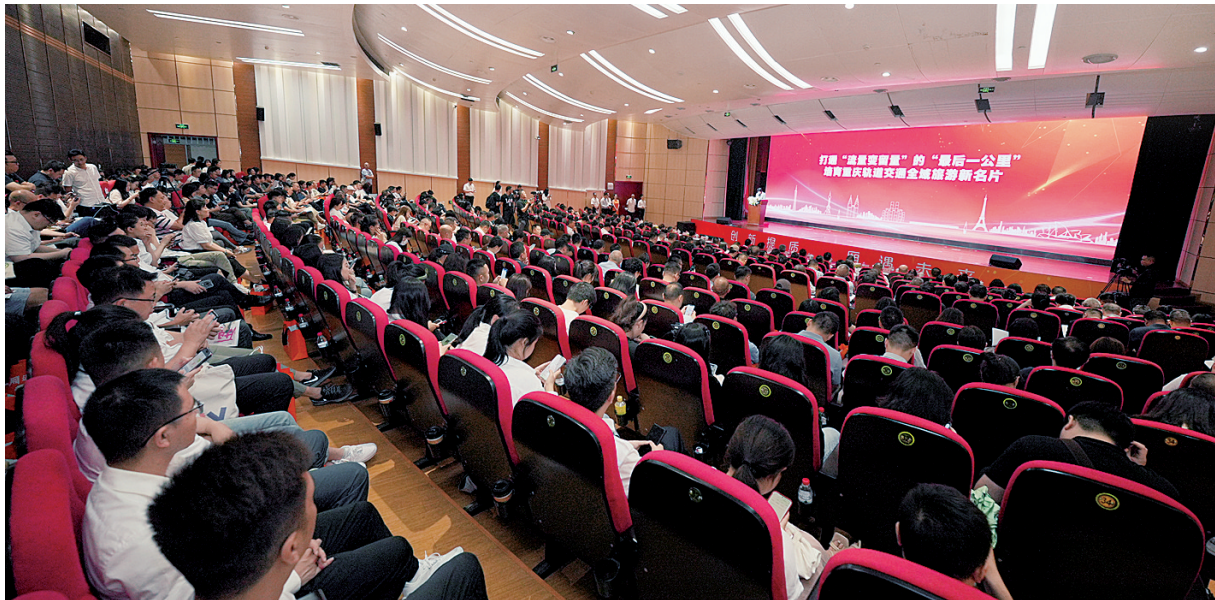
重庆轨道融媒创新发展大会现场

集团合作外，重庆轨道交通还储备了丰富的媒体资源，涵盖轨道列车车载媒体、站台厅平面媒体、创意展陈、公众号等多种形式。通过资源整合、路径重塑、市场细分、空间再造等方式，重庆轨道集团持续拓展轨道媒体的服务广度，不断创新“轨道+融媒体”发展路径，使“流量价值”转变为“留量价值”、将“资源优势”转变为“经济优势”，期待与各单位一道，借“寻找李子坝的下一站”主题活动，携手串点成线、联线成片，全力打造以轨道交通为载体的重庆全域旅游新名片。