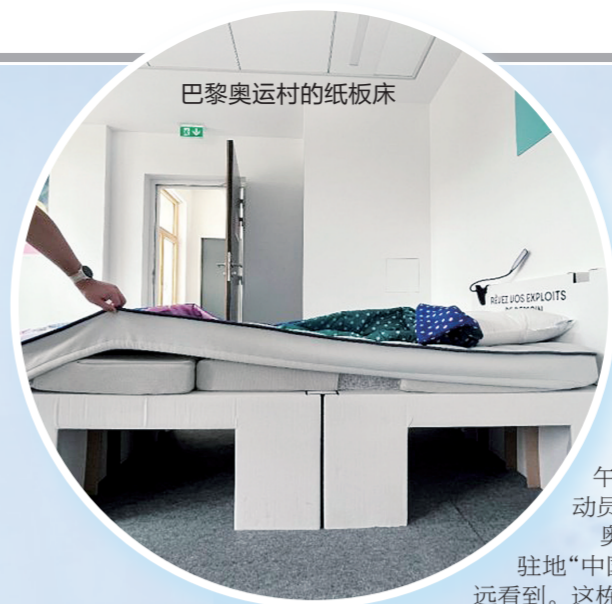
巴黎奥运村的纸板床