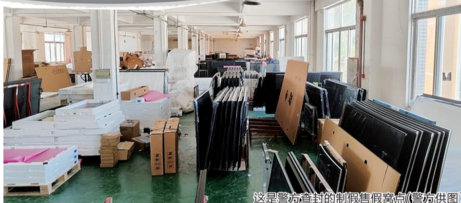
这是警方查封的制假售假窝点