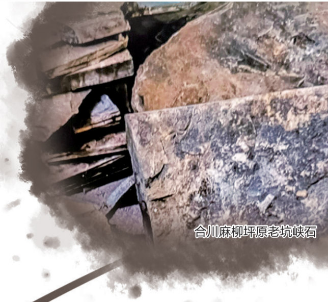
合川麻柳坪原老坑峡石

从涪涪江流,重新发现一方风物。从一刀一石,重新发掘一段历史。让我们驻足,寻觅抗战文化名人在山城、在北泉留下的诗词、墨宝。重新回顾巴渝文房四宝之合川峡砚与北泉石砚,清晰可见这对翡翠姊妹艺术的历史留存和沿革。一方石砚,尺度神韵,笺染云生,浓缩百年风采。古人曰:“武士爱剑,文人爱砚。”作为“文房四宝”之一的砚台,在中国历史上不仅是读书人必备之物,甚至达官贵人也将其视为宝物。砚的质料有铁、陶、瓷、铜、煤精、砖、瓦等。但是,最为常见和适用的则是各具地方特色的石砚。其质坚固,传百世不朽。对于砚台的要求,用北宋文学家、书画家苏轼的话说:“不涩留笔,滑不拒墨,即为好砚。”