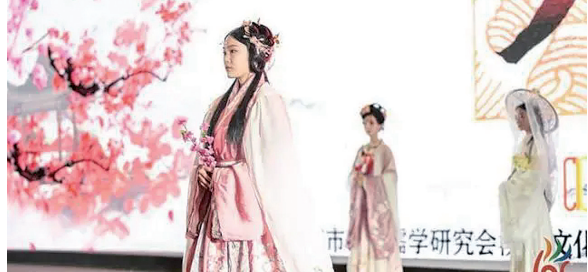
往届重庆文博会汉服比赛现场 资料图