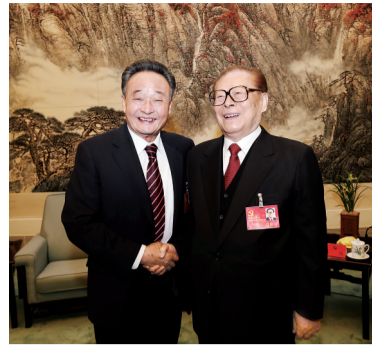
2012年11月14日，中国共产党第十八次全国代表大会在北京闭幕。这是闭幕会前，江泽民同志与吴邦国同志在一起。