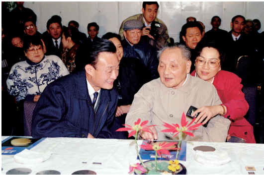
1992年2月10日，邓小平同志在上海贝岭微电子制造有限公司参观时与吴邦国同志交谈。