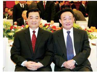
2005年1月1日，全国政协在北京举行新年茶话会。这是胡锦涛同志与吴邦国同志在一起。