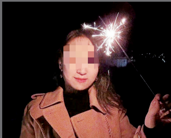
小娄生前照