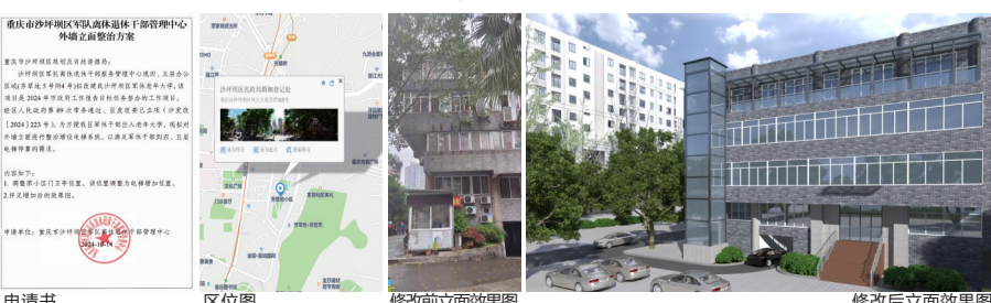
申请书 区位图 修改前立面效果图 修改后立面效果图

联系电话和邮寄地址，在2024年11月8日前将书面意见、房产证(或购房合同)等证明涉及其利害关系材料邮寄或直接提交至重庆市沙坪坝区规划和自然资源局。逾期未提出的，视为同意修改事宜或自动放弃权利。 重庆市沙坪坝区军队离休退休干部管理中心、相关利害关系人可自公示期满之日起11月8日前(五个工作日)，向重庆市沙坪坝区规划和自然资源局提出书面听证申请，并提交房产证(或购房合同)等证明涉及其利害关系的材料。逾期未提出的视为自动放弃听证权利。 重庆市沙坪坝区规划和自然资源局地址：重庆市沙坪坝区凤天大道13号，邮编：400000 联系人：刘老师 联系电话：6521331