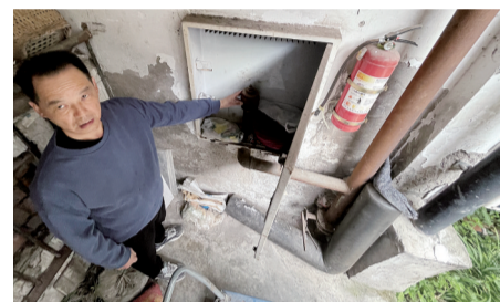
2栋居民也发现消防箱里没有水带和其他设施，只有垃圾杂物。

邓经理表示，物业公司也每年都把消防设施设备存在严重问题，以及准备动用大修基金维修部分业主反对的情况汇报给了所属的翠屏路社区和宝圣湖街道。