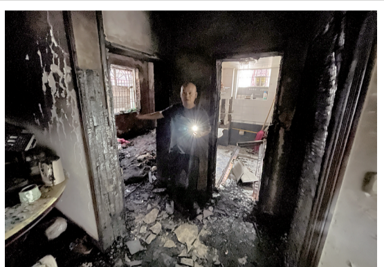
卫生间的门也被烧坏倒在地上