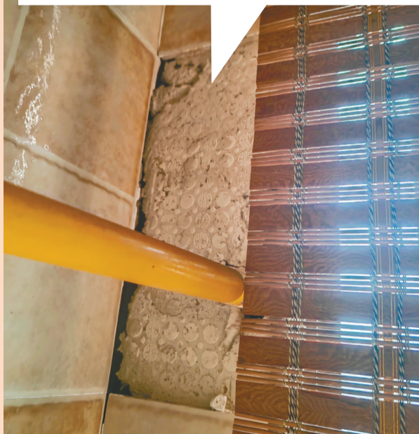
入住不到一年,阳台、卫生间、厨房墙砖脱落。