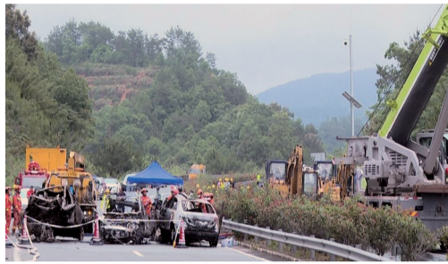
事故现场紧急救援 资料图

虽然，两项费用在评估报告中确认无法单独区分，但第一项费用是车损险理赔的范畴，而对第二项费用依照法律规定，当事人在履行合同约定