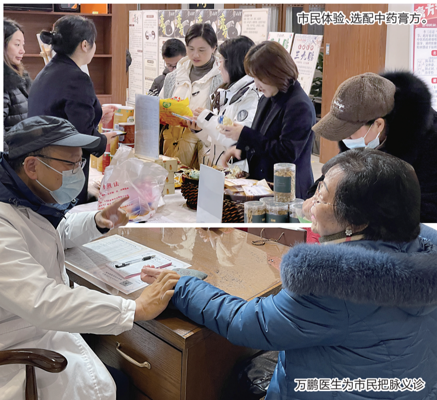
市民体验、选配中药膏方。