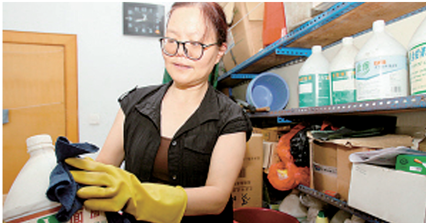
使用不同清洁剂时最好戴好防护手套

洗衣液和84消毒液混合后，会产生中和反应，既破坏了84消毒液的消毒效果，又导致洗衣液中的有效成分降低。