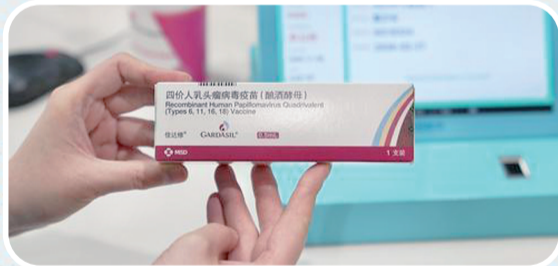
社区卫生服务中心护士展示HPV疫苗