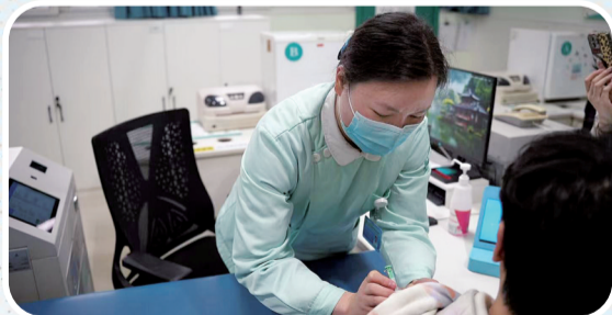
市民正在接种HPV疫苗 据新重庆-重庆日报