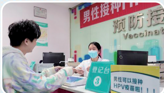
护士正在核验该区首针HPV疫苗男性接种者的信息