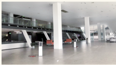
4S店内已经撤场的展厅