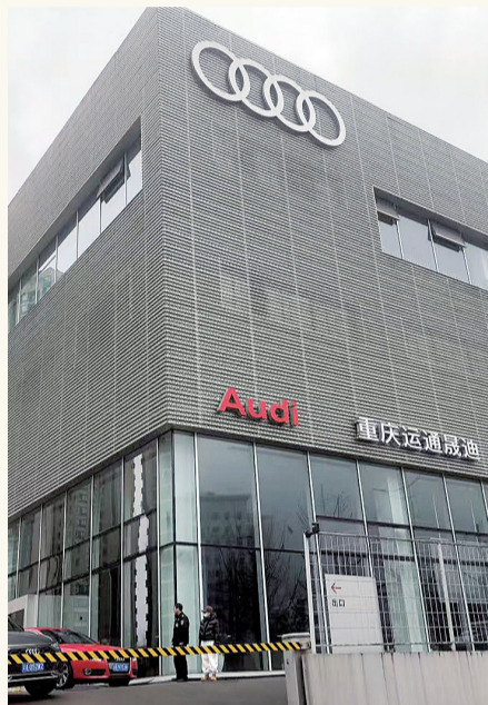
车主在4S店大门口，等待解决问题。

七八年，曾遇到消费者维权被骂、被围攻，大家都积极勇敢地面过去。但这次出事，经理一直还忽悠大家做事，却不谈工资的事。“春节前一直没有发工资，老板还让大家安心工作，节后第一时间给大家发工资。结果2月9日左右，4S店突然撤场，没有人跟他们说工资如何处理。”