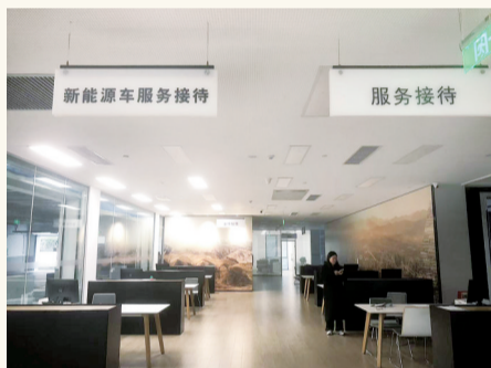
接待中心空无一人