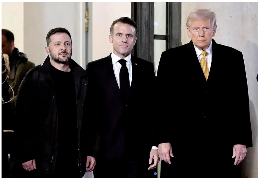
2024年12月7日，法国总统马克龙（中）与美国当选总统特朗普（右）和乌克兰总统泽连斯基会后走出爱丽舍宫。

特朗普随即在佛罗里达州海湖庄园举行的记者会上作出回应：“我听到（乌方说）‘哦，我们没有受邀（参加俄美会谈）’。好吧，你们（与俄方战事）已经三年了，你们本该在三年内结束它，本不该（让冲突）开始，本