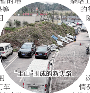
“土山”围成的断头路

此外，小区东门车库出入口也受到影响，进出车库的车辆只能走大学城北路，通往大学城大道一头的出口被“土山”彻底堵死，进出需要绕一个大圈。