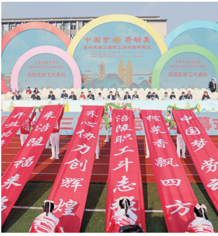
2024年3月28日，重庆市第三届职工运动会在綦江区开幕。

职工合法权益保障持续加强。持续推进“普惠性+特殊性”标准化权益维护体系建设。规范建立工会劳动争议纠纷人民调解委员会，集中组织“春风送法律·平安万里行”“送法进基层·一点就到家”等活动400余场，提供法律咨询7300余次，惠及职工群众30万人次。联合印发《外卖即时配送平台安全生监管管理职责分工方案》，组织职工参加网上“安康杯”等群众性安全生产活动210万人次，排查化