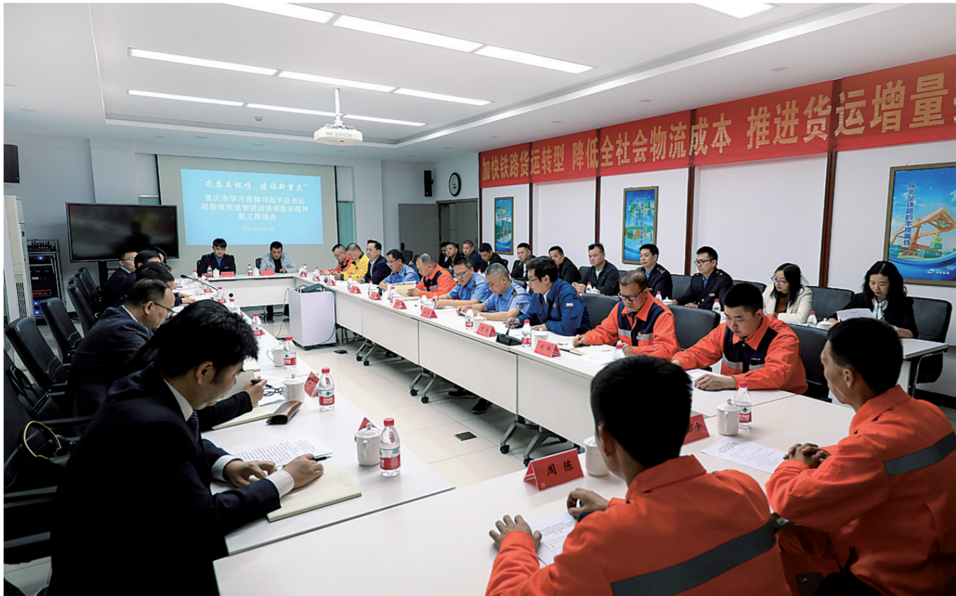
2024年5月1日，重庆市学习贯彻习近平总书记视察重庆重要讲话精神职工座谈会在团结村中心站召开。

职工建功立业力量充分汇聚。主动融入和服务国家重大战略、构建“33618”现代制造业集群体系等中心工作，主办、承办、联办、协办“一带一路”国际技能大赛、中欧班列（重庆）技能竞赛、西部陆海