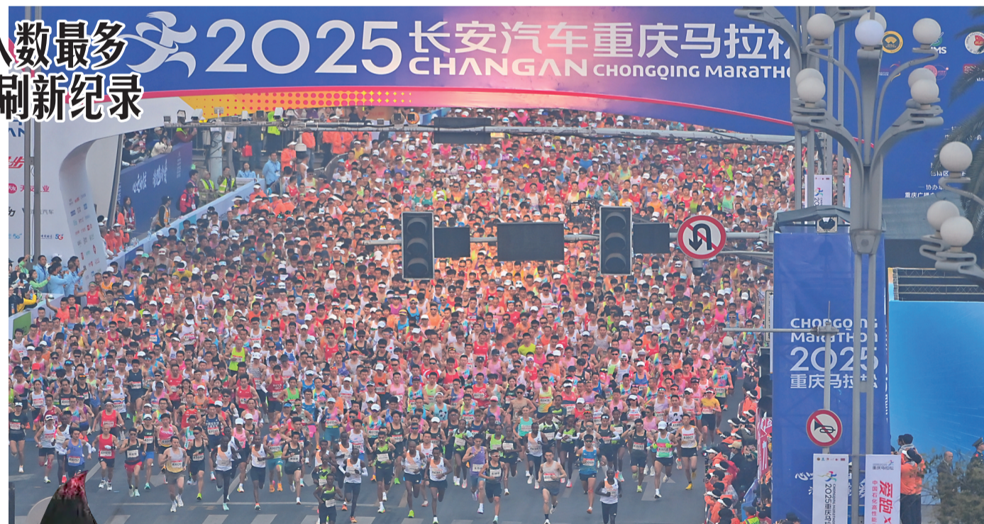
2025重庆马拉松在南滨路鸣枪起跑