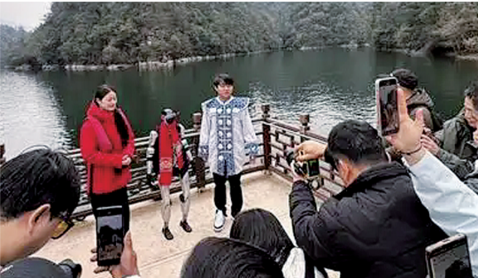
机器人“笨笨”出现在湖南张家界景区,游人争相拍照。