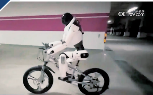
人形机器人骑自行车 央视