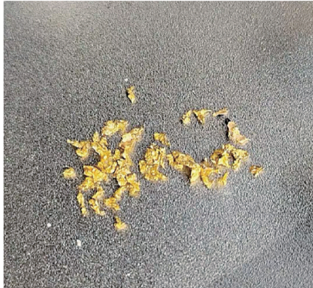
市民康先生“淘”出的金色颗粒