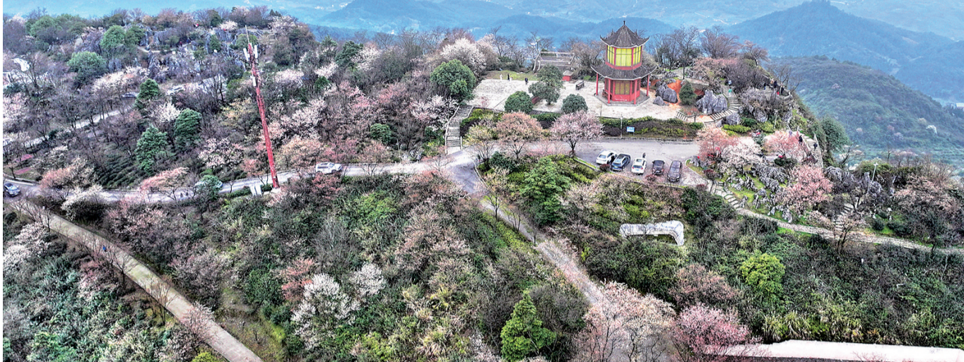
云龟山上,漫山遍野的野樱花在春风中肆意绽放,云蒸霞蔚,惊艳了整个春天。

春风有信花不误,别有洞天藏风华。3月12日,渝北区大盛镇天险洞村的云龟山上,漫山遍野的野樱花在春风中肆意绽放,云蒸霞蔚,惊艳了整个春天。由于去年冬季的暖冬天气,云龟山的万亩野樱花比往年提前一周左右开放,在3月中旬迎来第一波盛花期。