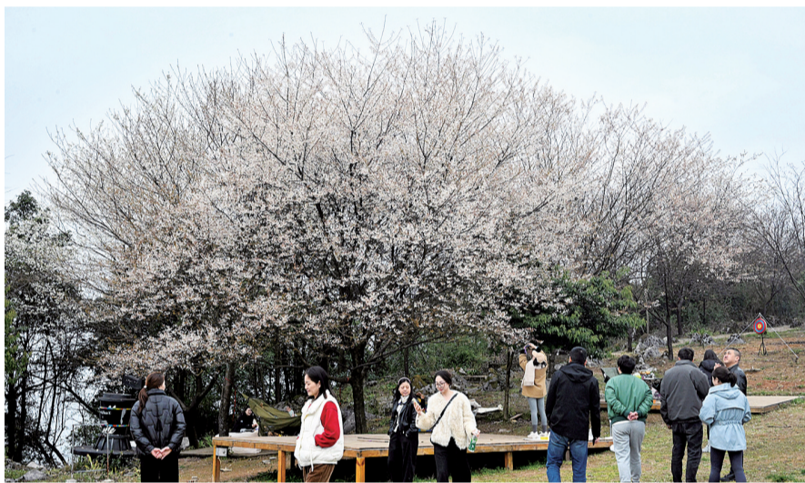
游客蜂拥而至,来此踏青赏花。