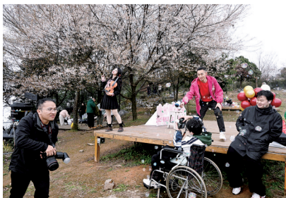
市民在野樱花树下拍照打卡