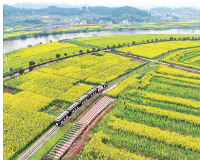
3月12日,游客乘坐“小火车”在重庆潼南崇龛花海景区游览。

在时下争奇斗艳的各色花种中,油菜花在川渝地区毫无疑问一定是“头牌”。从与中心城区近在咫尺的北碚文凤村、南岸广阳岛,到久负盛名的潼南陈抟故里,再到万州甘宁镇、云阳栖霞镇……满目金黄正在尽情怒放。根据重庆市气象局的预测,今年重庆全市油菜开花期将普遍较常年偏晚3~5天。其中,海拔200米以下的区域,最佳观赏期为2月下旬至3月上旬;最晚为海拔1000米以上区域,直到3月中旬才开始进入最佳观赏期。为此,记者专门整理了这样一份油菜花的赏花指南,大家收藏好直接按图索骥即可。