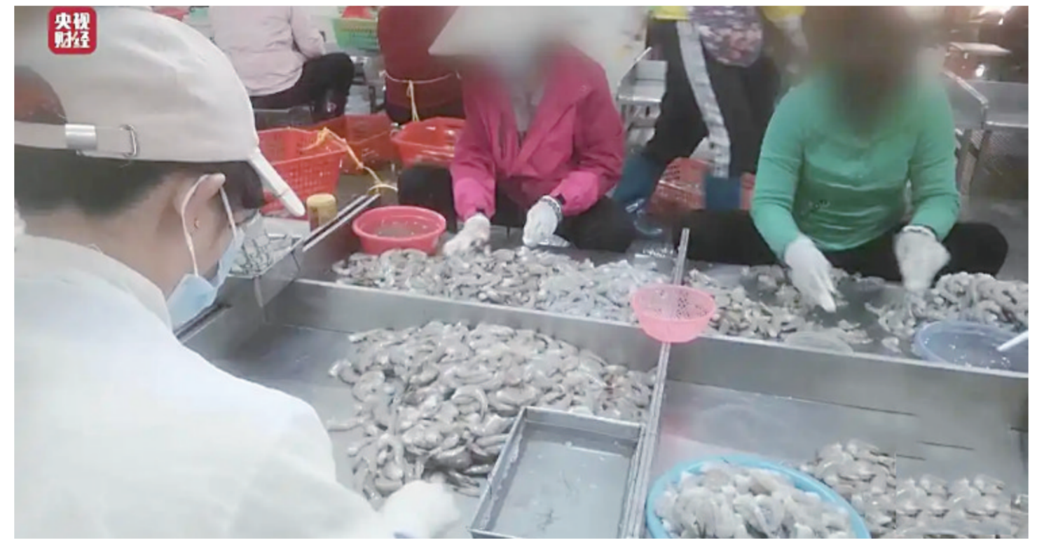
视频曝光部分企业在加工“保水虾仁”时超限量使用保水剂、过度包冰的问题 视频截图

翻新卫生巾、保水虾仁、未灭菌一次性内裤、手机抽奖“疯狂敛财”、“电子签”高利贷…… 3月15日晚，央视总台“3·15”晚会曝光翻新卫生巾、保水虾仁、一次性内裤未经灭菌、手机抽奖“疯狂敛财”、“电子签”高利贷等多个行业乱象，引发舆论广泛关注。相关部门针对曝光问题，迅速作出回应。 市场监管总局：全面彻查！针对“保水虾仁”（详情）、非标电线电缆（详情）等涉及市场监管领域的违法行为，市场监管部门连夜开展执法行动，依法严惩绝不姑息。 工信部：立即关停，全面清理！针对智能机器人拨打营销骚扰电话、虚商实名制要求落实不到位（详情）等问题，工业和信息化部作出以下部署：连夜组织北京、上海、广东等地通信管理局对涉嫌违法违规主体进行调查处置；责令基础电信运营商立即关停涉事线路；对涉个人数据信息有关情况进行检查；督促互联网平台企业全面清理违法智能外呼软件销售推广信息；将持续采取有力措施，强化对基础电信运营商、虚拟运营商、呼叫中心企业监督检查；严厉查处违法违规企业，加大曝光力度；积极配合有关部门依法打击网络黑灰产业等违法犯罪行为，全力营造安全健康的信息通信消费环境。