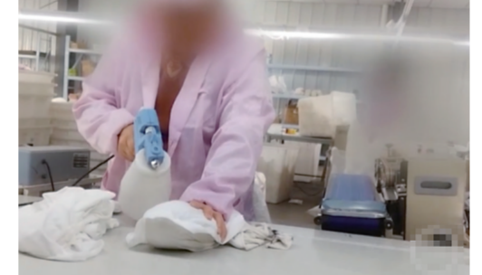
河南某企业生产的一次性内裤不灭菌 视频截图