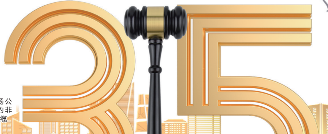
五金市场公开售卖的非标电线电缆