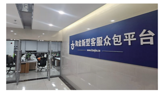
四川某借贷平台被查处