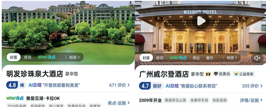
网络上查询到的五星级酒店的房价比以前降低了

这些酒店行业的深刻变革，在以亚朵、全季为代表的中端连锁酒店异军突起的背景下，高端酒店开始“自救”。