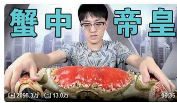
大祥哥吃“6000元帝王蟹”的视频