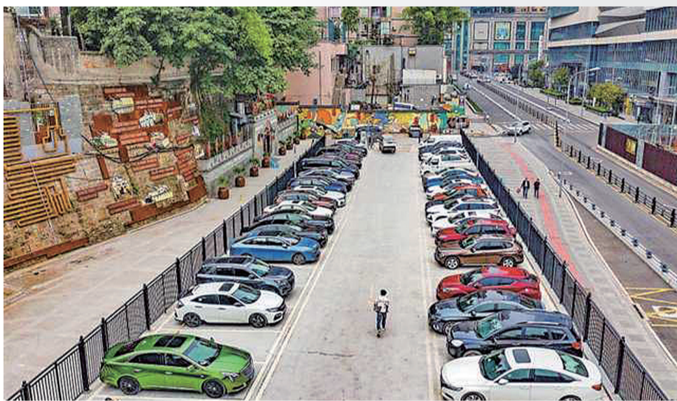
中迪廣場外側小微停車場 據新重慶-重慶日報