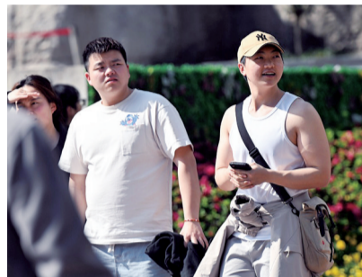
江北区观音桥，小伙子脱下外套 穿起背心。 据新重庆-重庆日报

升温迅速，降温也是同样迅速。市气象台首席预报员邓承之介绍，截至下午3点，26日重庆市内最高气温已超34℃，与常年同期气温相比，可能偏高了6~9℃。在这种明显偏暖的情况下，北方有一股强冷空气将会从3月27日的午后开始影响重庆东北部，在夜间影响重庆的大部分地区。预计到3月29日，重庆市中心城区最高气温将跌至15℃，相比之前算得上直接“打五折”。“这股强冷空气会带来剧烈的降