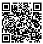
关于中美经贸关系若干问题的中方立场全文请扫描二维码

白皮书表示,中方始终认为,中美经贸关系的本质是互利共赢。作为发展阶段、经济制度不同的两个大国,中美双方在经贸合作中出现分歧和摩擦是正常的,关键要尊重彼此核心利益和重大关切,通过对话协商找到妥善解决问题的办法。贸易战没有赢家,保护主义没有出路。中美各自取得成功,对彼此都是机遇而非威胁。希望美方与中方相向而行,按照两国元首通话指明的方向,本着相互尊重、和平共处、合作共赢原则,通过平等对话磋商解决各自关切,共同推动中美经贸关系健康、稳定、可持续发展。